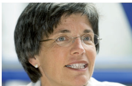
Lucrezia Meier-Schatz bringt langjährige politische Erfahrung mit.

gen, Kritik und Druck umzugehen. Diese Fähigkeiten sind auch in einem Exekutivamt gefragt.