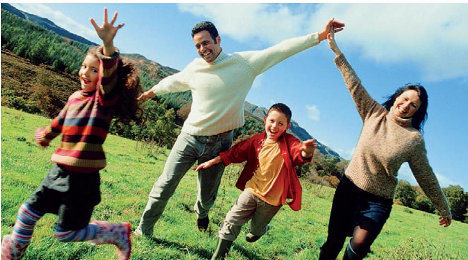
Die CVP will, dass Familien mit Kindern weniger Steuern zahlen müssen.