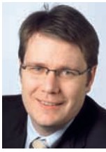
Von Benedikt Würth, Vize-Fraktionspräsident

Schlagzeilen zu Gewaltexzessen vorab von Jugendlichen sind an der Tagesordnung. Oft erstatten die Opfer aus Angst vor weiteren Übergriffen keine Anzeige. Die Politik muss handeln – ohne Polemik, aber konsequent. Die CVP hat im Kantonsrat konkrete Lösungsansätze eingebracht.