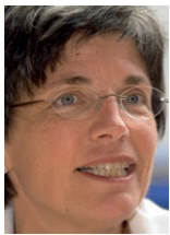
Von Lucrezia Meier-Schatz, Nationalrätin

Würde die Initiative für eine Einheitskrankenkasse am 11. März angenommen, müsste einmal mehr der Mittelstand die Zeche bezahlen: Er würde zusätzlich belastet. Mit dem Monopol würde den Versicherten zudem jegliche Wahlfreiheit genommen.